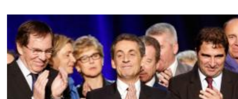
Départementales : la droite (36,4%) en tête du premier tour, loin devant le PS et ses alliés (28%), le FN à 25%