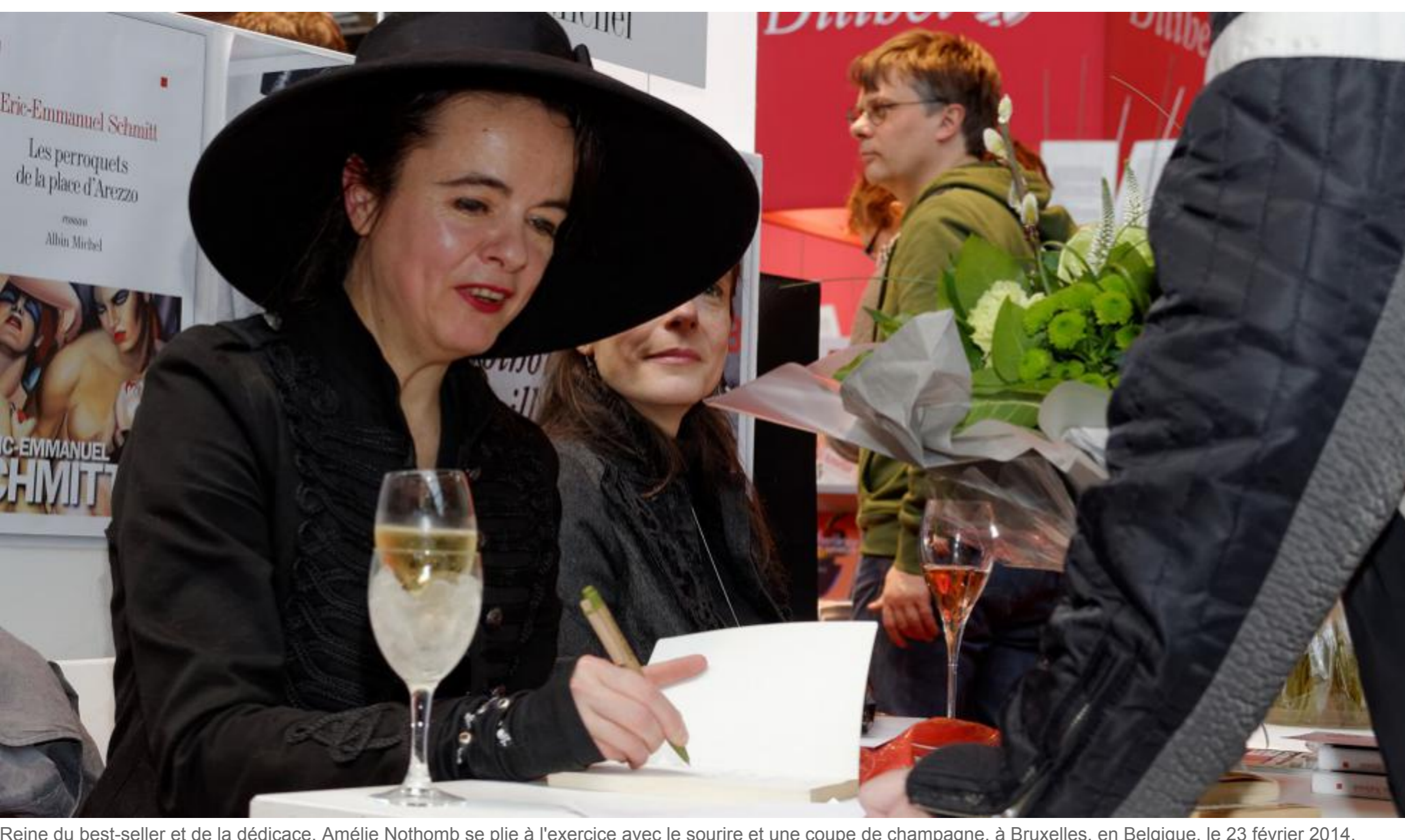
Reine du best-seller et de la dédicace, Amélie Nothomb se plie à l'exercice avec le sourire et une coupe de champagne, à Bruxelles, en Belgique, le 23 février 2014.