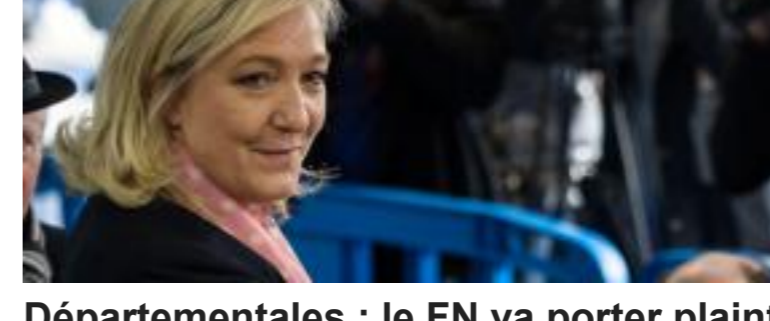
Départementales : le FN va porter plainte contre SOS Racisme après un tweet