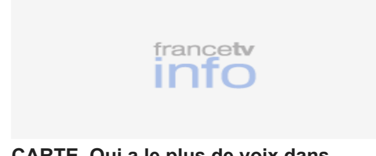
CARTE. Qui a le plus de voix dans chaque département ?