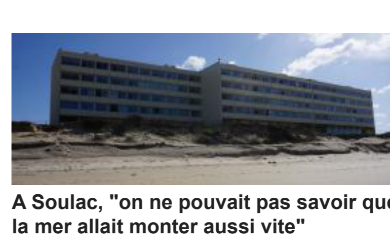
A Souillac, "on ne pouvait pas savoir que la mer allait monter aussi vite"