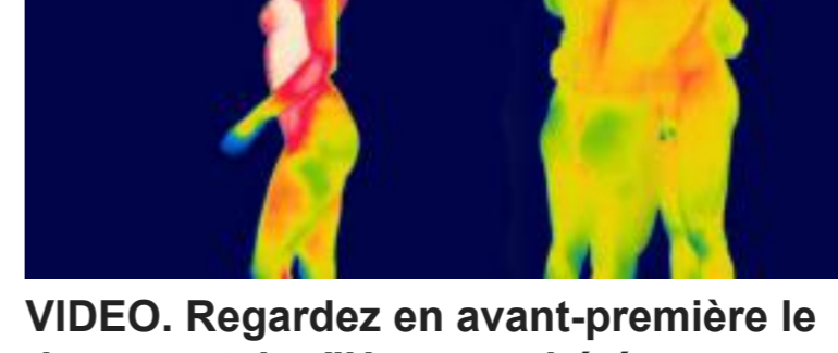
VIDEO. Regardez en avant-première le documentaire "Homo ou hétéro, est-ce un choix ?"