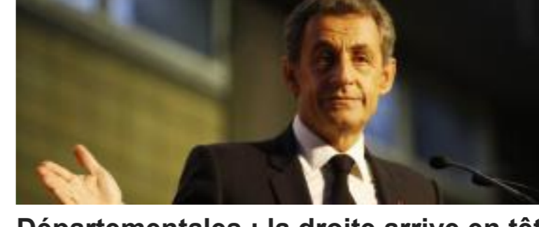
Départementales : la droite arrive en tête au 1er tour avec 36,4%, selon une estimation Ipsos / Sopra Steria