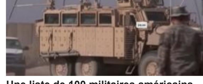
Une liste de 100 militaires américains menacés de mort divulguée sur internet