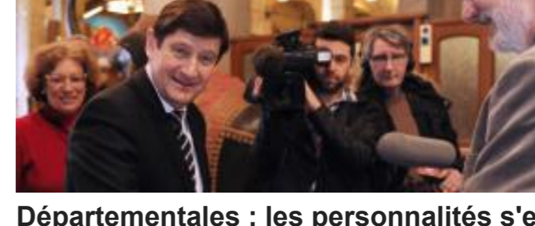
Départementales : les personnalités s'en sortent bien au premier tour