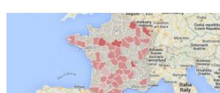
CARTE. Les départements où l'abstention est la plus forte au premier tour