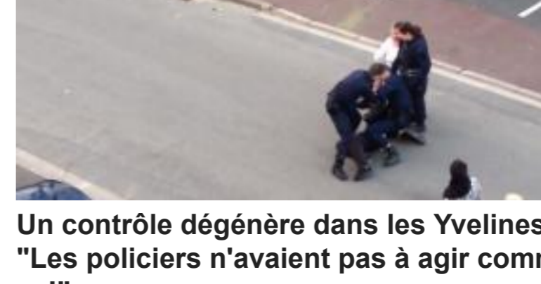
Un contrôle dégenère dans les Yvelines : "Les policiers n'avaient pas à agir comme ça"