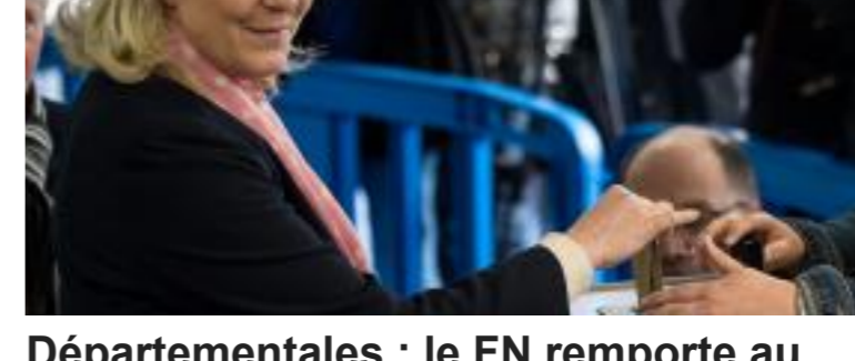
Départementales : le FN remporte au moins 4 cantons dès le premier tour