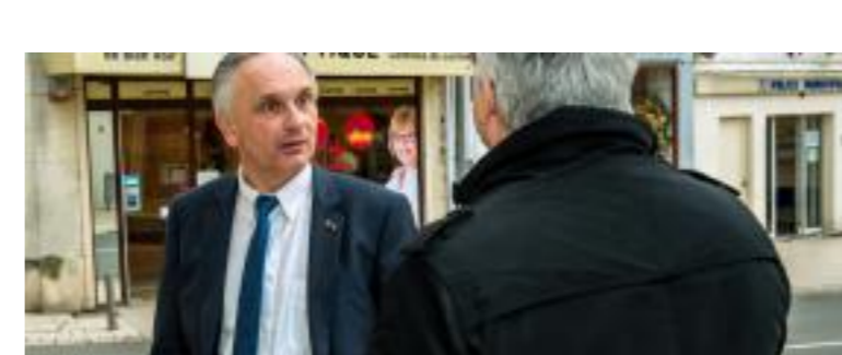
Départementales : le Front national en pole position dans l'Aisne