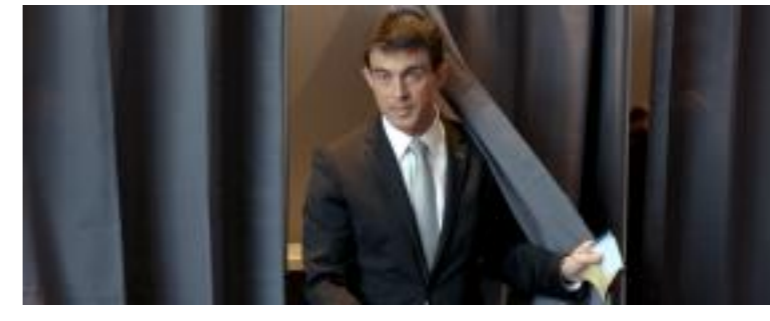
DIRECT. Départementales : 196 élus de droite, 50 de gauche et 6 FN élus au premier tour, selon l'Intérieur