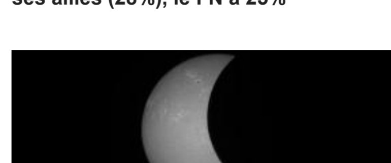
DIRECT. En France, l'éclipse solaire gâchée par la météo