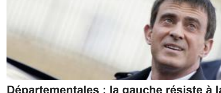
Départementales : la gauche résiste à la poussée du Front national