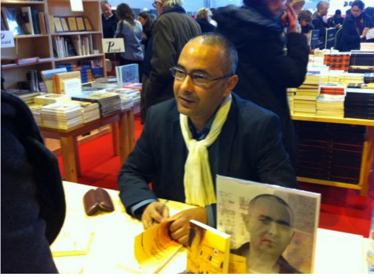
Kamel Daoud dédicace son dernier roman, "Meursault, contre-enquête" Actes Sud)